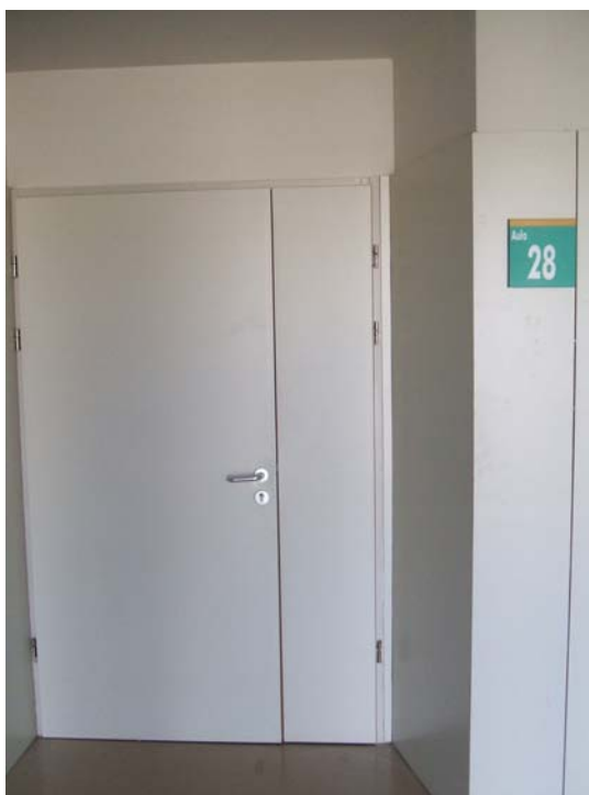
Modelo de puerta a instalar

Las puertas de acceso a Salón de acto y Seminarios serán de modelo, color y características similares a existentes en dicha facultad.