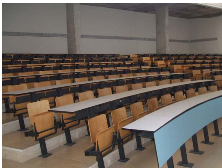
Estado actual Aulas a dividir