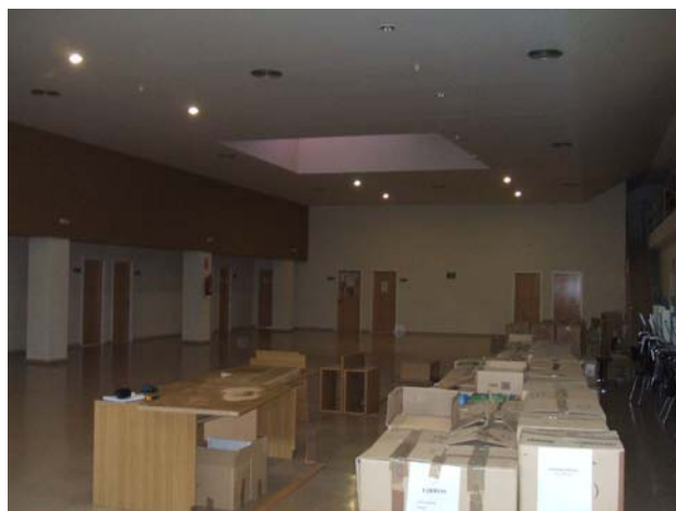
Espacio libre en sala de lectura donde ubicar Salón de actos y Seminarios